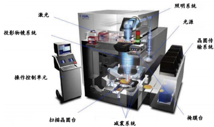
图：光刻机总体结构

光刻机是目前我们比较弱的环节，近年来大陆也投入了较多资金、研发进行研发，国产光刻机实现突破可以期待，我们将持续关注光刻机产业链以及光刻机的国产突破带来的投资机会