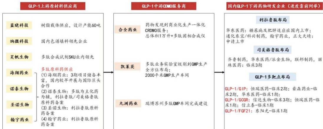
图3：GLP-1产业链相关全景图

产业链方面，公斤级别以上多肽API商业化生产涉及项目可能包括（1）原材料部分：氨基酸衍生物；树脂载体；溶剂等；（2）工艺设备部分：固相反应器，离心机，质谱分析仪等；（3）纯化环节：色谱填料，色谱柱等；（4）冻干/喷雾干燥环节：冻干机，喷雾干燥设备等。产业链外包服务看，国内CDMO公司如合全药业，凯莱英，九洲药业等搭建多肽团队及平台，提升GMP级别多肽产品交付能力。未来随着原研GLP-1药物专利到期，国内仿制药多点布局。上游产业链相关企业先发优势及规模效应将更为凸显。涉及到原料药公司、生产所需耗材及溶剂的相关企业。